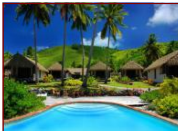
1ベッドルーム・バンガロー