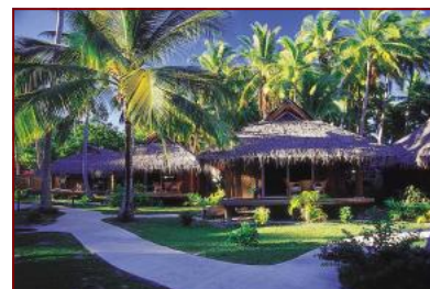
スタジオ・バンガロー