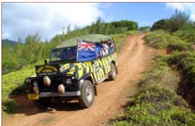
ラロ・サファリツアー

病院がある丘を急降下！両脇に谷がある険しい山道を登るとブアイクラの村と谷、刑務所の敷地が見えます