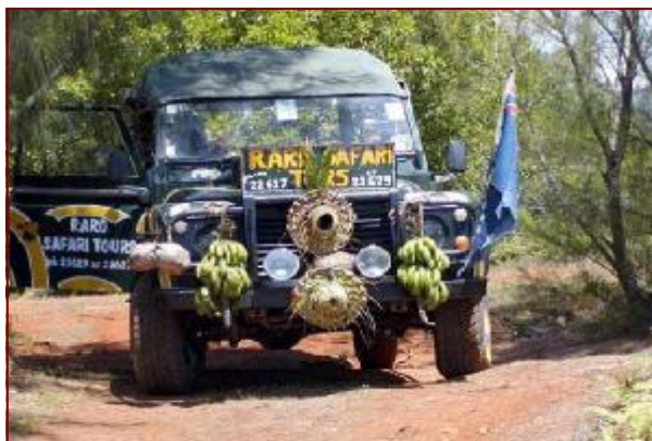
舗装されていないデコボコの道

病院がある丘を急降下！両脇に谷がある険しい山道を登るとブアイクラの村と谷、刑務所の敷地が見えます