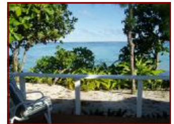
マテンガ・ビーチフロント