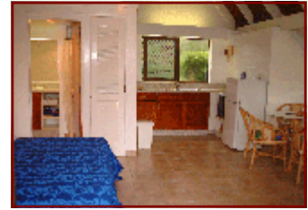
ガーデン・スタジオ