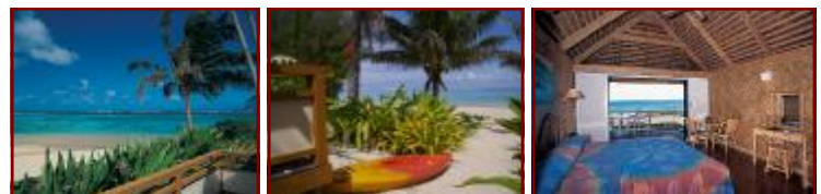
ビーチフロント・スタジオ