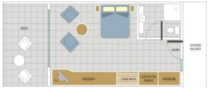
スーベリア・プールビュールーム